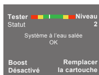
Écran à touches

Niveau de désinfection 0=système éteint, 10=désinfection maximum