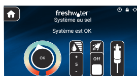
Affichage d'écran tactile

À l'aide d'une bandelette pour l'analyse de l'eau 5 fonctions FreshWater®, vérifiez l'eau pour vous assurer qu'un niveau de résidu de chlore d'au moins 3 ppm a été maintenu au cours des dernières 24 heures. Si le niveau de chlore est descendu en dessous de 3 ppm, répétez le processus de