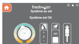
Affichage d'écran tactile